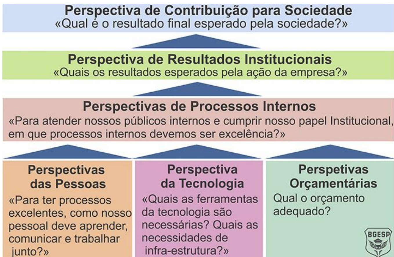
Modelo Mapa Estratégico